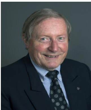
80 år er ingen alder for en ung mann ...