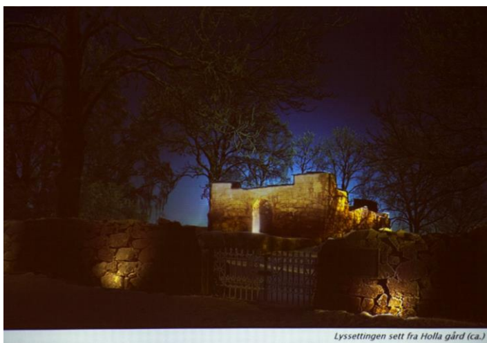
Lyssettingen sett fra Holla gård (ca.)

Ideen til belysning ble unnfanget av et «lyst» hode i 2014. Lyssetting av denne type ruin med denne spesielle beliggenheten vil bli meget spektakulært, særlig sett fra rv. 36 når man kommer fra Skien.