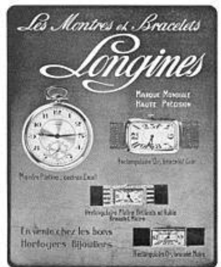
Lommeur og armbåndsur fra Longines anno 1924.