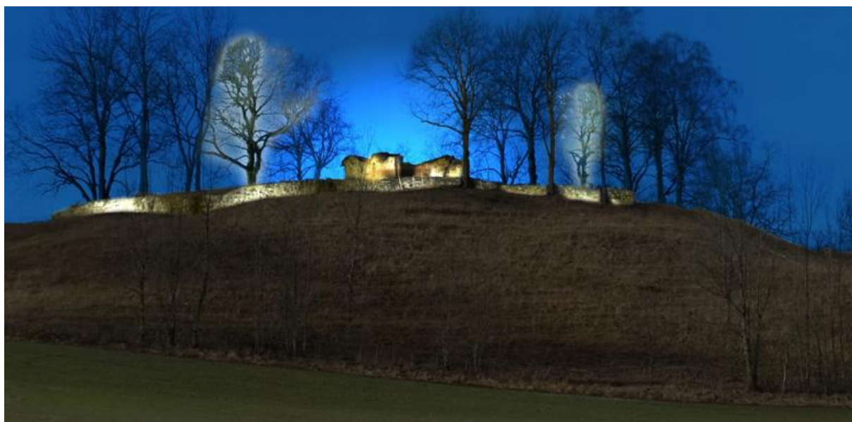
Den opplyste kirkeruinen på Høyden, slik man tenker seg den sett fra rv. 36. (Bilde fra Ulefoss idéforums Facebook-side)

Totalkostnaden er beregnet til kr 1 850 000. Finansieringen