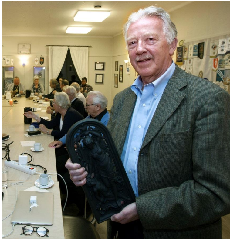
Ulefoss-damer vekker alltid åtgaum ...

Sjå artikkel frå 2015 i Teknisk ukeblad her !