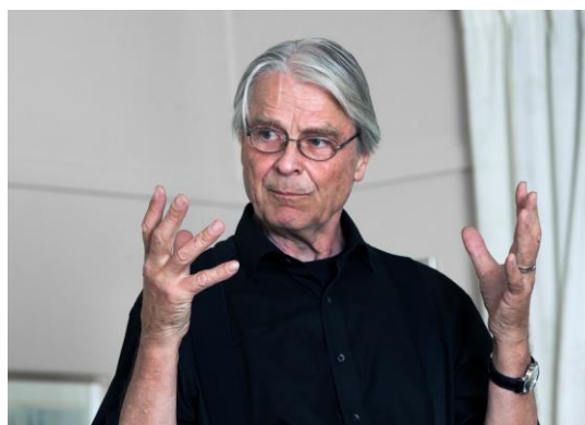
Carl Schiøtz Wibye