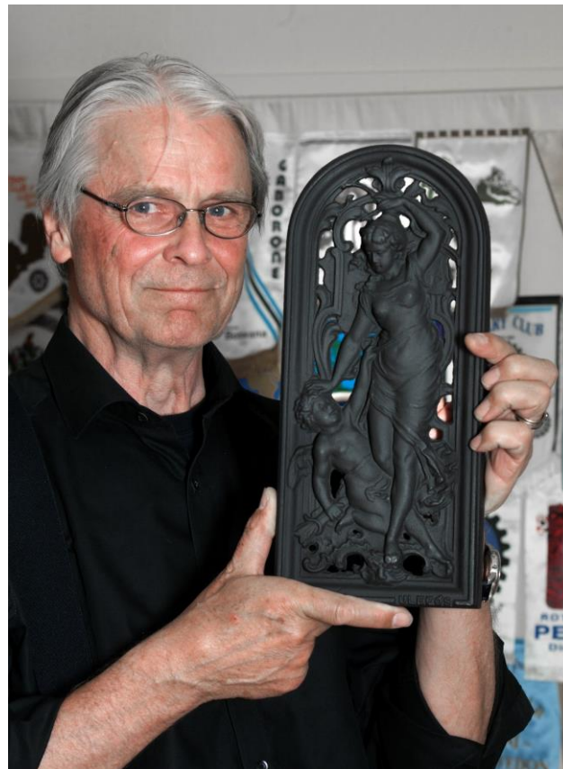
Disse Ulefoss-jentene, ja, de får mange interessante bekjenskaper ...