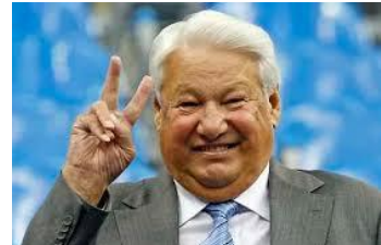
Orientekspresen, Sputnik og Boris Jeltsin. (Jeltsin til høyre)