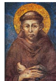
Frans av Assisi

Merkedag: På primstaven finner vi for denne dagen et halvkors, til minne om Den hellige Franciscus, altså Frans av Assisi. Var det fint vær denne dagen, ville det vare ut oktober. Dette lover godt for denne måneden i år.