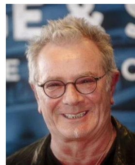
To store musikere – den ene større enn den andre: Bach og Åge Aleksandersen. Åge til høyre.