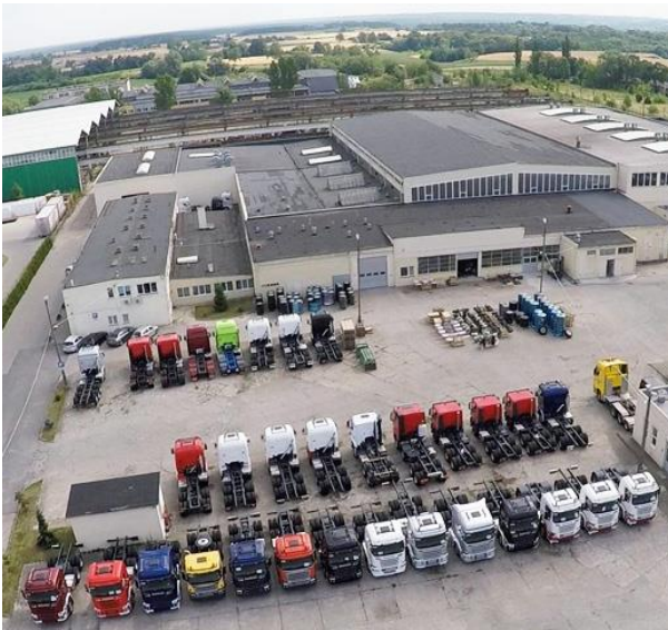
Istrails fabrikk i Golub-Dobrzyń, Polen