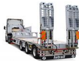
Et produkt fra Istrail